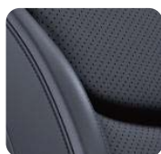
1UL Skóra Nappa Czarna