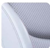
XSD Skóra Nappa Szara