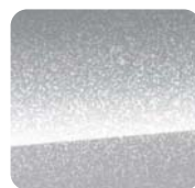
5CH Billet Silver Metaliczny