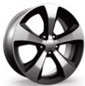
WPR Aluminiowe felgi 18\"/>