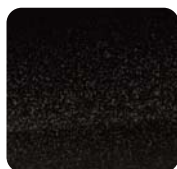
802 Diamond Black Perłowy