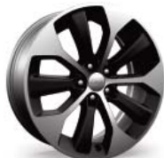
WSX Aluminiowe felgi 19\"/>