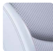
XSJ Skóra Nappa Szara